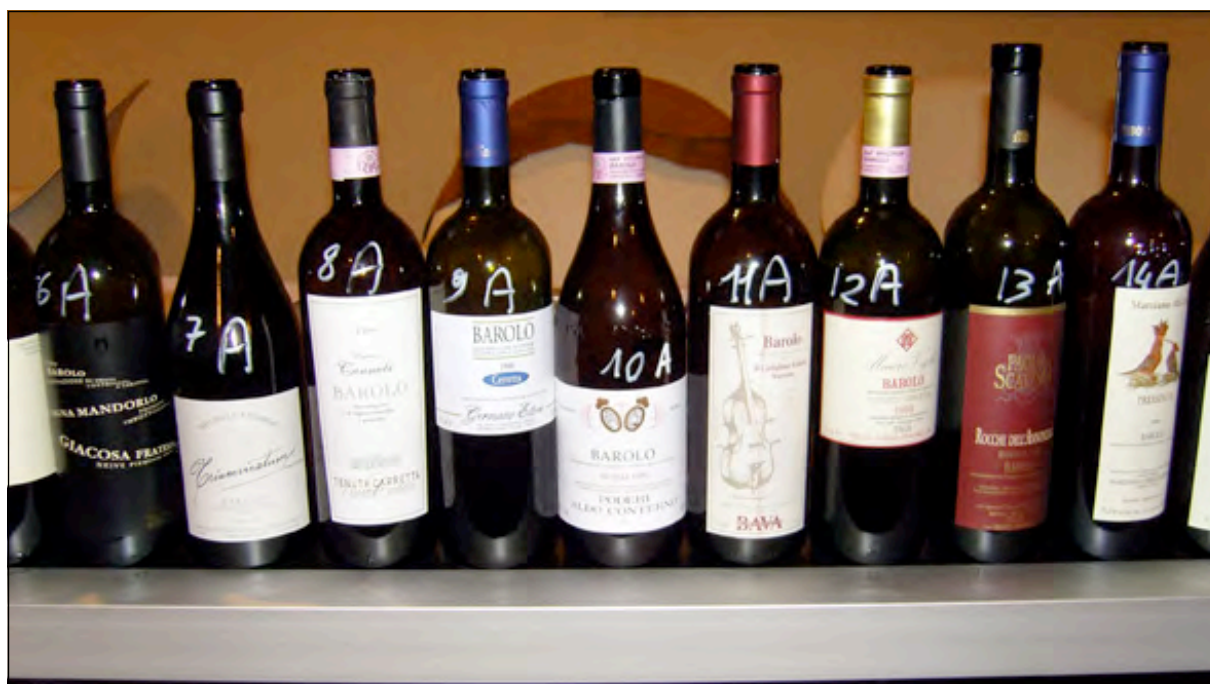
Sélection des Barolos 1999. Dégustation chez Carretta.