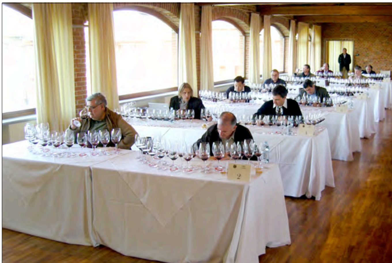
Salle de dégustation à la Tenuta Carretta. Dégustation chez Carretta.

Nous n'avons qu'une hâte : recommencer dès que possible une dégustation de ces fleurons du vignoble mondial, dans un autre millésime dont on espère autant de satisfaction.